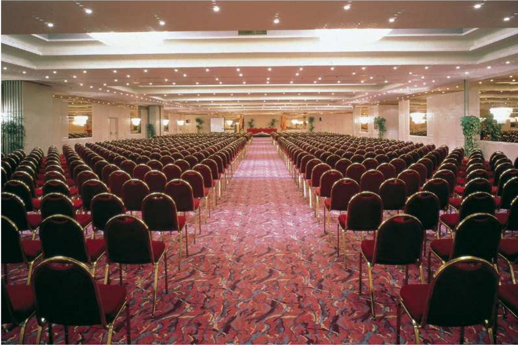
Salón de reuniones