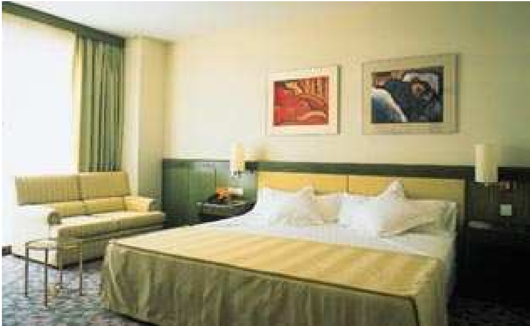
Habitación doble standard